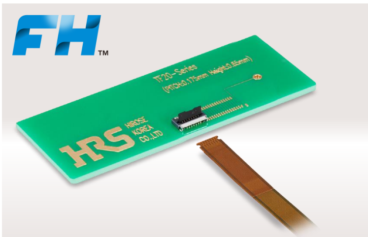
FH Flip-Lock Pioneer Hirose